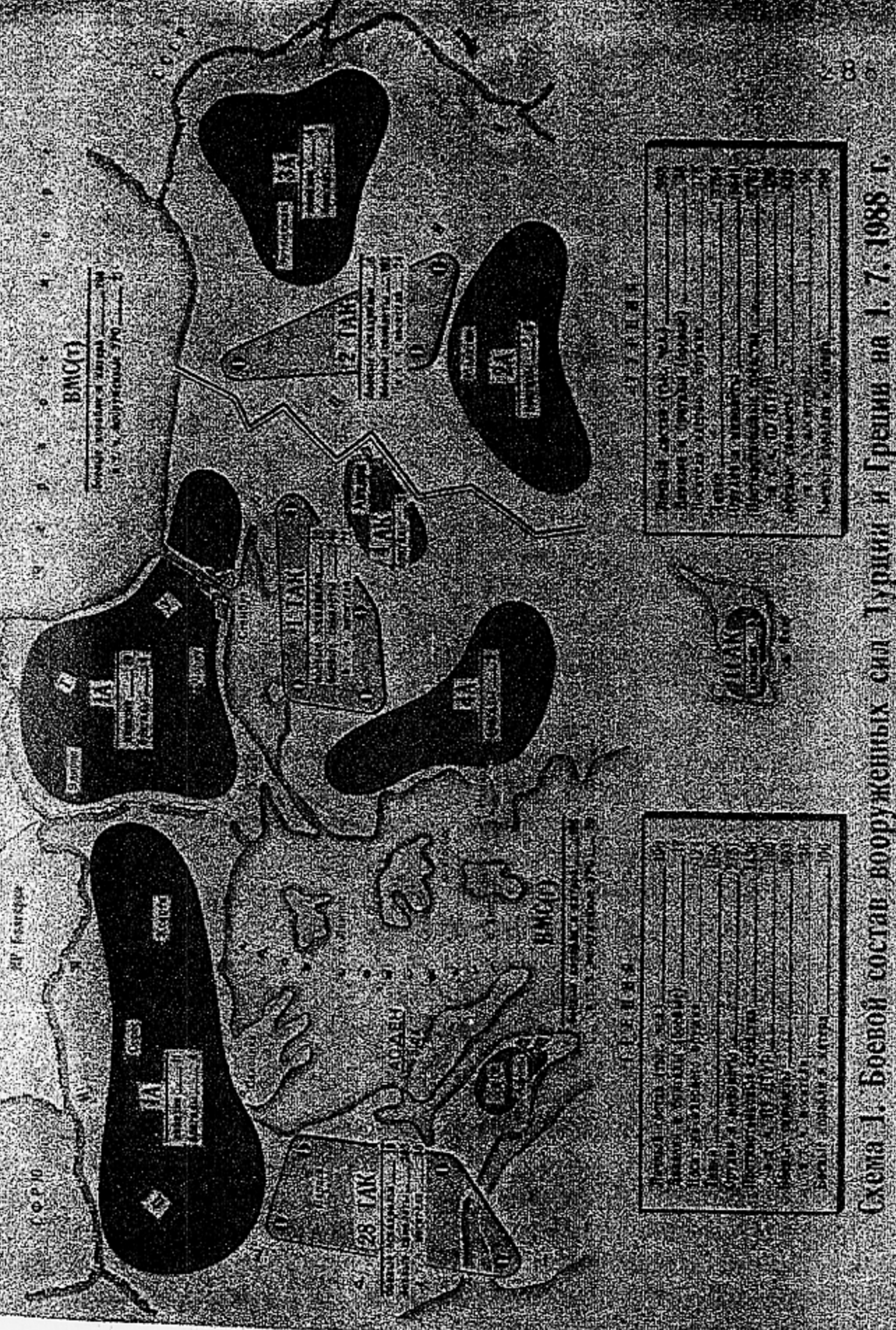
Схема 1. Боевой состав вооруженных сил Турции и Греции на 1.7.1988 г.